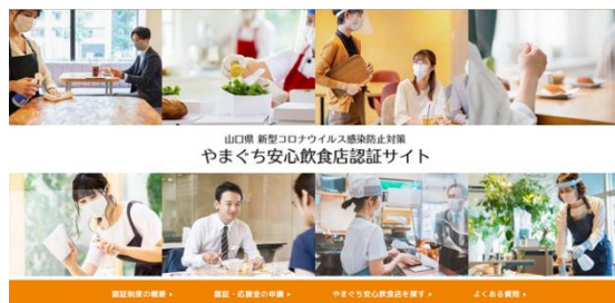
やまぐち安心飲食店認証サイト (専用ホームページ)